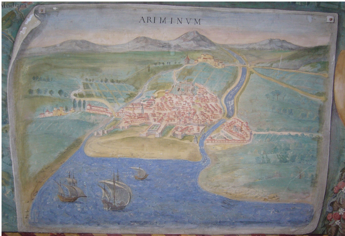
Immagine di Rimini (1580 - 1583) Ignazio Danti, Galleria delle Carte Geografiche Musei Vaticani