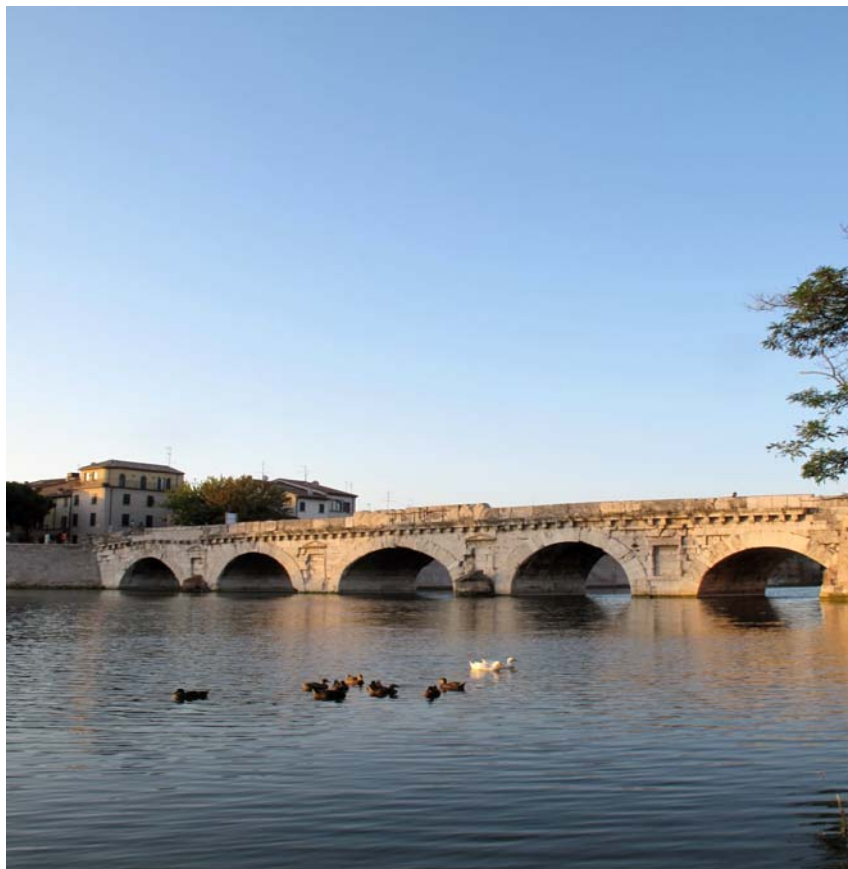
Ponte di Tiberio