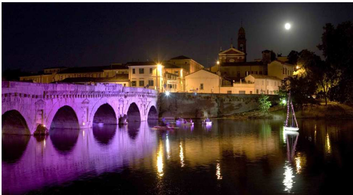
Ponte di Tiberio