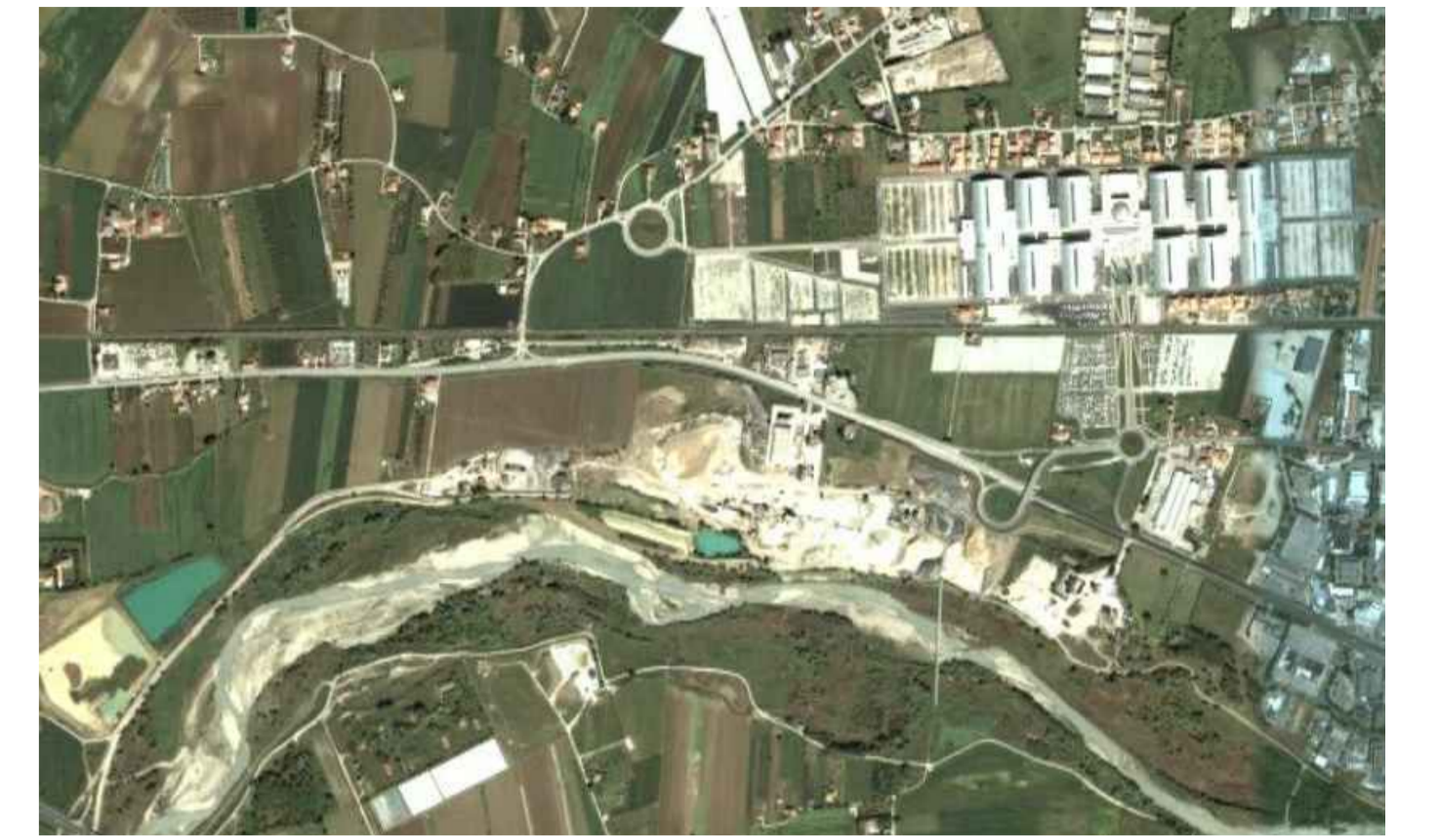
IMPIANTO ATTUALE - vista dello stato di fatto Planimetria d'insieme - foto aerea dell'area

Limite distanza 150 dal Fiume Area in proprietà ditto "Pesaresi Giuseppe S.p.a."