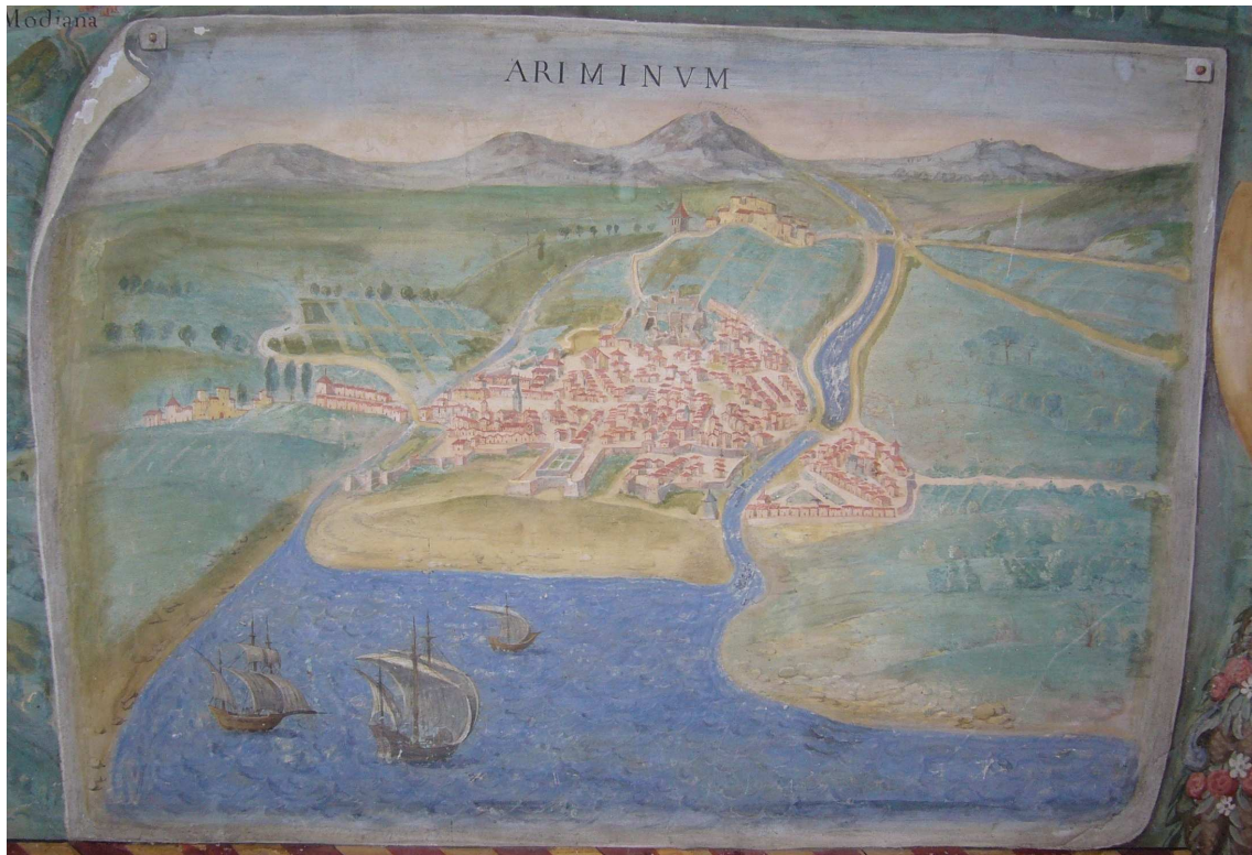
Immagine di Rimini (1580 - 1583) Ignazio Danti, Galleria delle Carte Geografiche Musei Vaticani