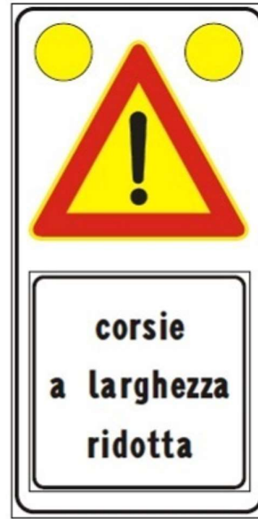
Figura II 391c Art. 31