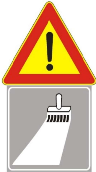
Figura II 391 Art. 31