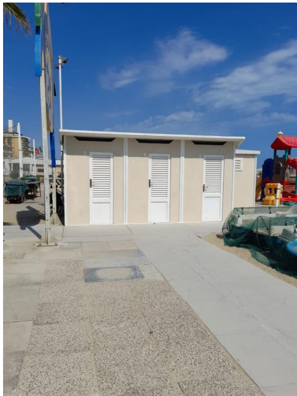
CABINE SPOGLIATOIO CONFINE SPIAGGIA N.10

Comune di Rimini Direzione Generale Settore Ufficio di Piano Ufficio per il Paesaggio Via Rosaspina, n. 21 - 47923 Rimini, tel. 0541 704890 - fax 0541 704990 c.f.-p.iva 00304260409, www.comune.rimini.it dipartimento3@pec.comune.rimini.it