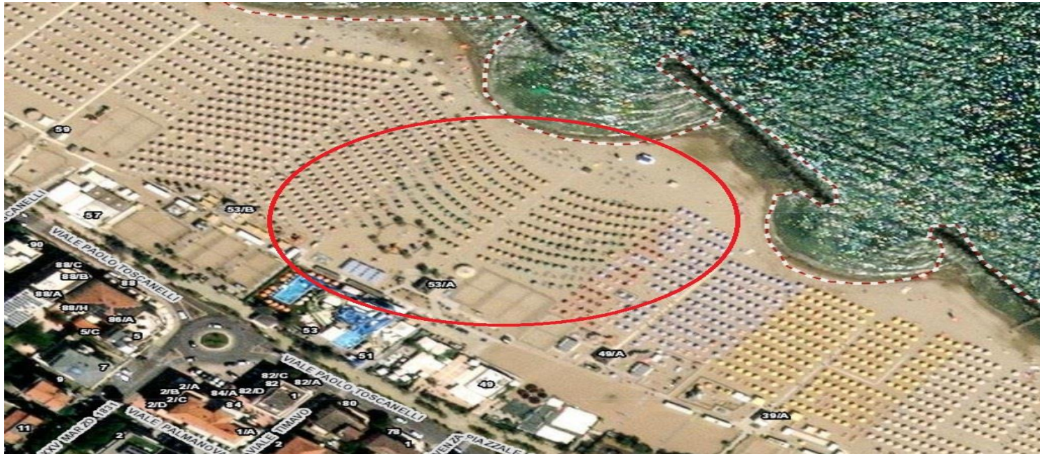
BAGNO OTELLO SPIAGGIA N.09 RIVABELLA DI RIMINI VIALE PAOLO TOSCANELLI 53/A

RICOSTRUZIONE DELLO STABILIMENTO BALNEARE "BAGNO OTELLO N.09", POSTO A RIVABELLA DI RIMINI, IN VIALE PAOLO TOSCANELLI N.53/A, PREVIA DEMOLIZIONE DELLE ATTREZZATURE