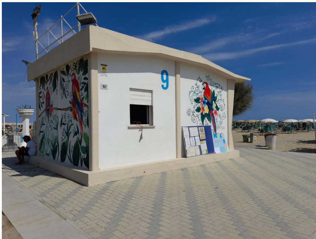
CABINA DIREZIONE - RECEPTION

Comune di Rimini Direzione Generale Settore Ufficio di Piano Ufficio per il Paesaggio Via Rosaspina, n. 21 - 47923 Rimini, tel. 0541 704890 - fax 0541 704990 c.f.-p.iva 00304260409, www.comune.rimini.it dipartimento3@pec.comune.rimini.it