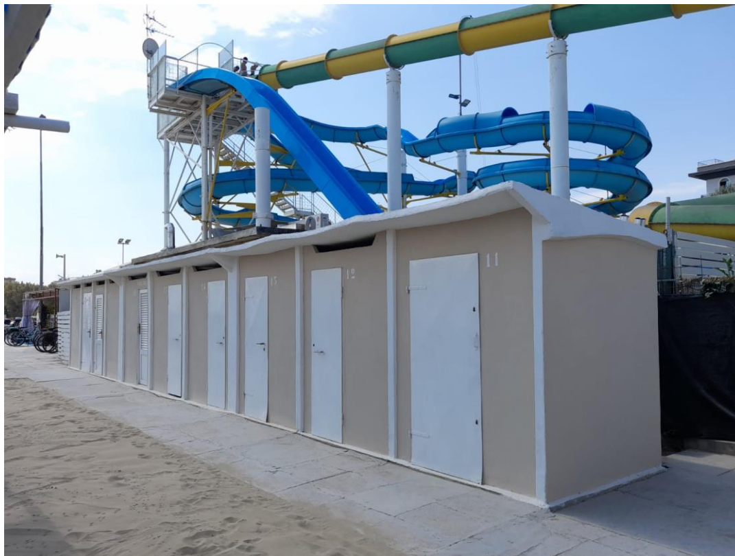
CABINE WC-SPOGLIATOIO A CONFINE CON IL PARCO ACQUATICO