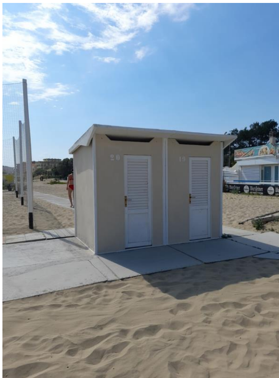
CABINE SPOGLIATOIO CONFINE SPIAGGIA N.08