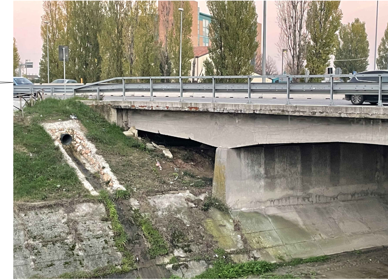
Tubazione di scarico SdF