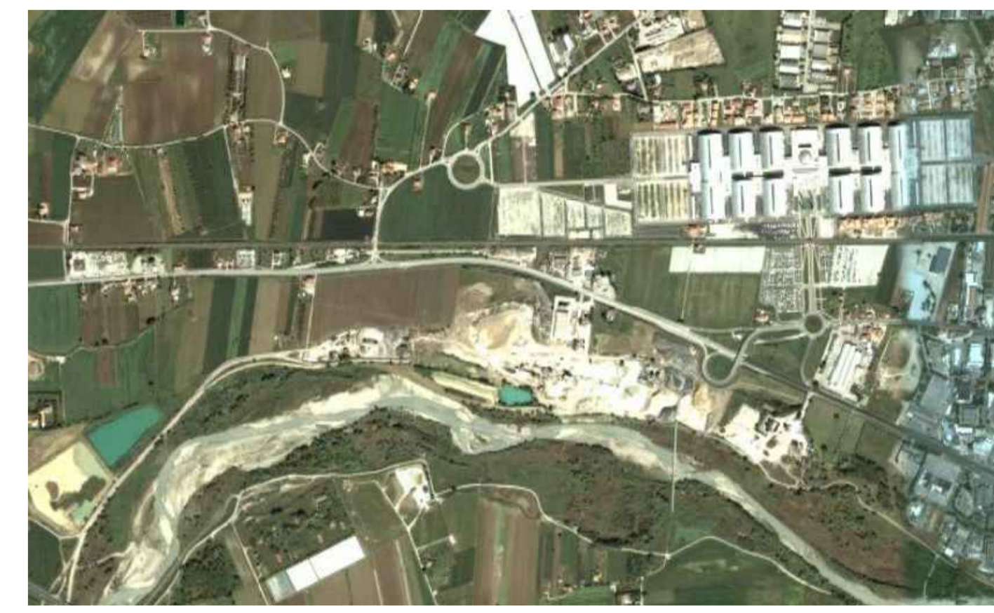
IMPIANTO ATTUALE - vista dello stato di fatto Planimetria d'insieme - foto aerea dell'area