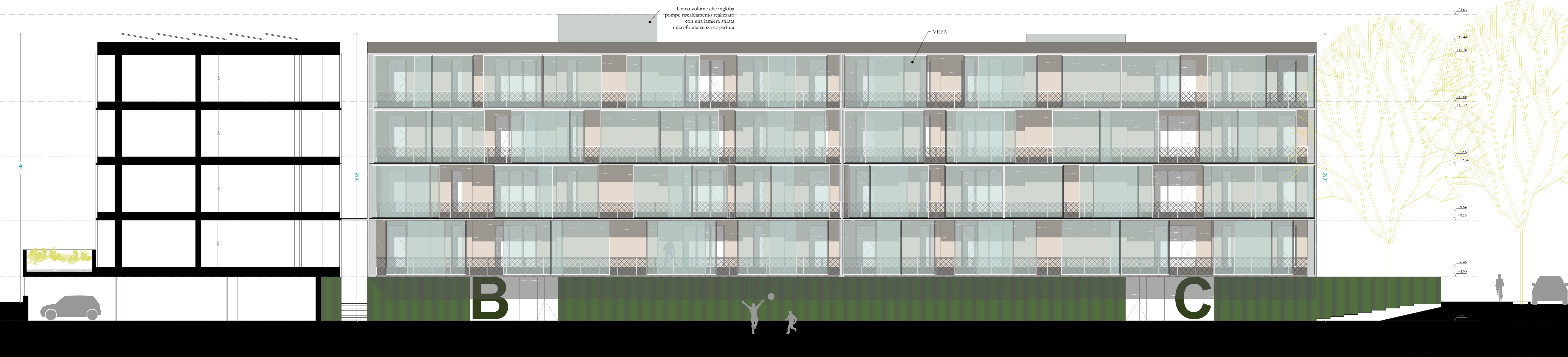
Sezione-prospetto BB, scala 1:100