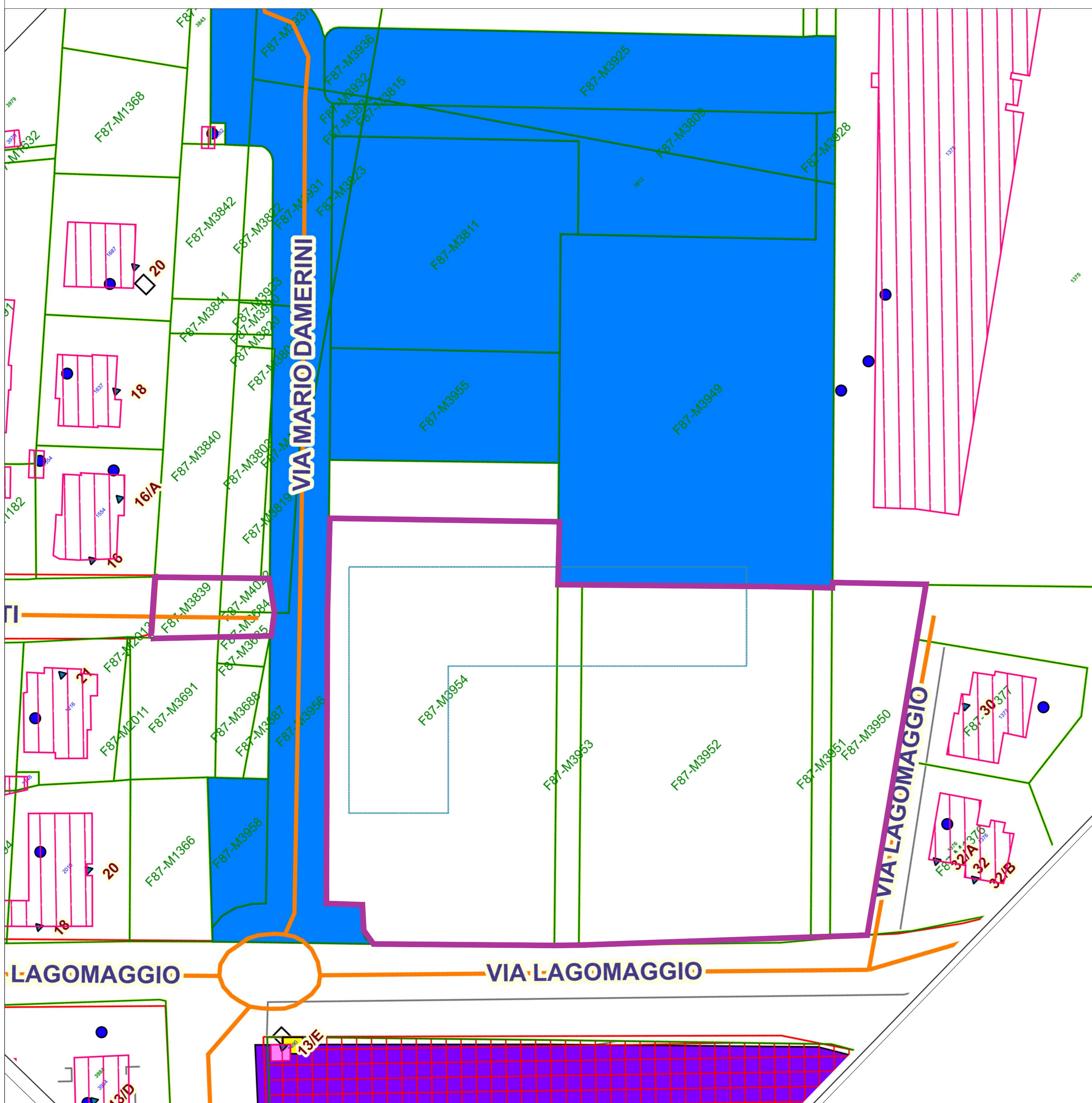
Planimetria catastale con indicazione delle particelle e del sedime del progetto, scala 1:500