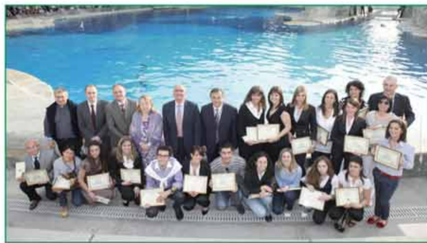
In alto: i Soci allo spettacolo dei delfini. Sopra: i premiati con le borse di studio anno 2008.

Per Banca Malatestiana è molto importante, in questo momento critico dell'economia, sapere che l'affiancamento e il sostegno dato alle imprese e alle famiglie, che costituiscono la maggioranza della sua base sociale e con le quali è consolidato un rapporto fondato sulla reciproca fiducia, viene avvertito come fattore fondamentale della politica aziendale. Mentre si svolgevano i lavori assembleari, i famigliari dei soci hanno potuto visitare il Parco e godere di tutte le sue attrazioni. Al termine dell'assemblea, presso la laguna dei delfini sono state consegnate le borse di studio ai soci e ai figli dei soci che si sono diplomati o laureati a pieni voti nel 2008; con lo spettacolo dei delfini, una delle più belle attrattive del Parco, e il buffet a cura de "I Girasoli" Catering & Banqueting si è chiusa la serata.