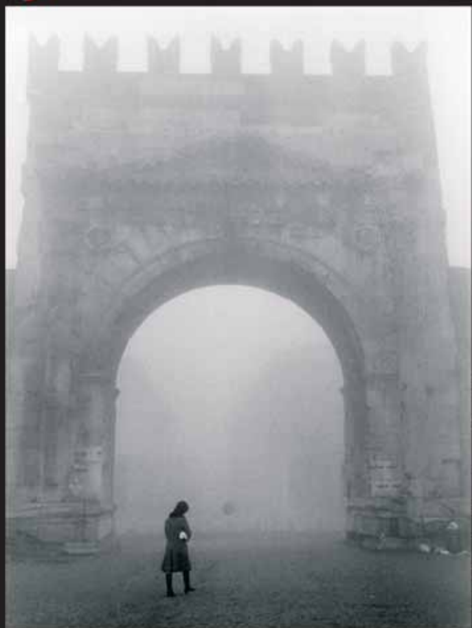
Davide Minghini, Arco d'Augusto con nebbia, 1987

patrocinio Istituto Italiano per gli Studi Filosofici