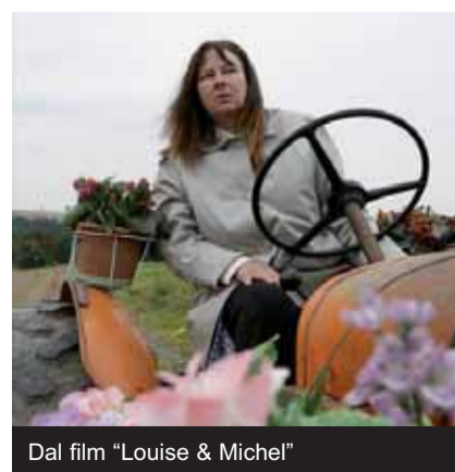
Dal film "Louise & Michel"

Una rete di contributi che si è andata allargando sempre più: all'associazionismo culturale e sociale riminese, nonché all'organizzazione di alcuni eventi di sensibilizzazione civica.