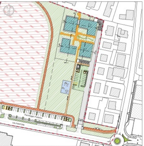
PLANIMETRIA GENERALE - scala 1:1000

NTA - Art. 8: Piano interrato ed autorimesse degli edifici. Ai sensi dell'art. 21 del "Piano Stratico di Boccia per l'Assente Idrogeologico (P.A.I.) Variante 2016", (deliberazione del Comitato Istituzionale n. 1 del 27/04/2016, pubblicata sulla Gazzetta Ufficiale in data 29/04/2016); "L'autorità di Bacin Diocesana, predispone una direttiva per la sicurezza idraulica in Pianura in relazione al rischio di Bonifica. Nelle more dell'attuazione di quanto previsto al punto precedente, quali misure di salvaguardia immediatamente vincolanti all'Adozione del presente progetto di variante al P.A.I. nelle aree soggette ad alluvioni frequenti (elevata probabilità-P3, come quelle in oggetto) è vietata la realizzazione di vari interrati accessibili". Pertanto, la rappresentazione di vari interrati nella tavola di P.P. è puramente indicativa e si rimanda alla legislazione di settore vigente al momento della presentazione degli atti abilitativi relativi ai fabbricati.