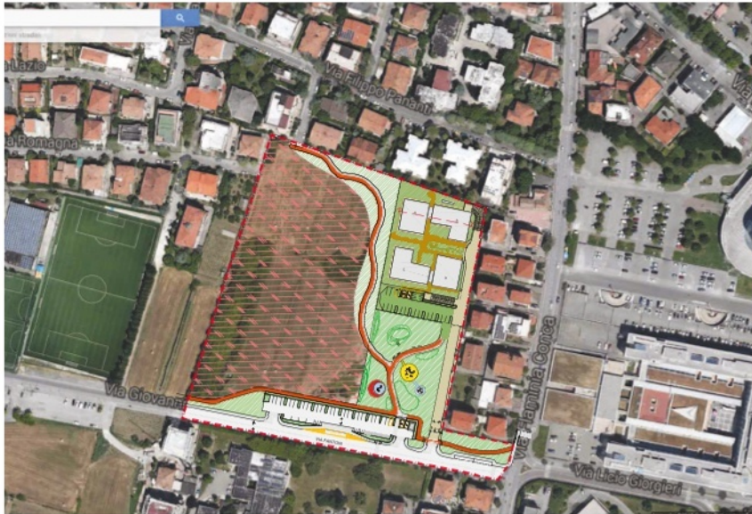
PLANIMETRIA - scala 1: 2000